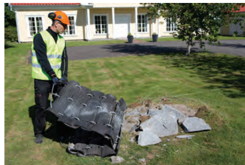
Ulike bruksområder for Simplex